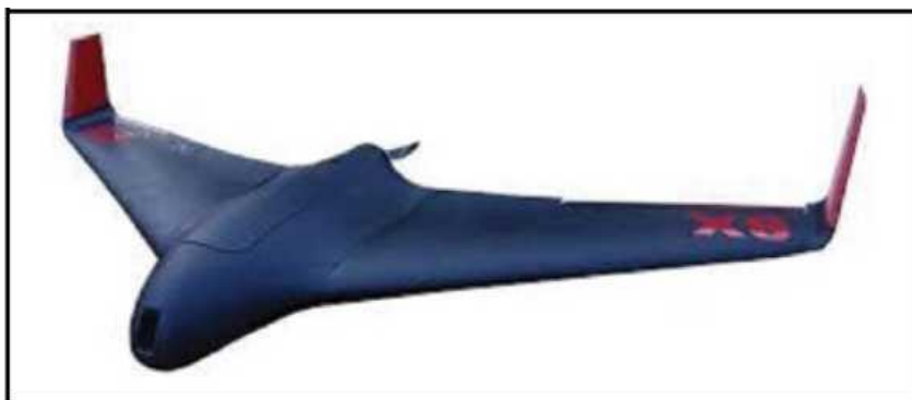
Рис. № 7 – БПЛА тип «летающее крыло».