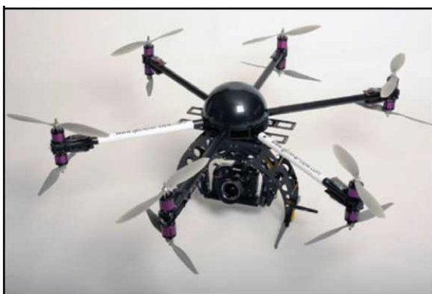
Рис. № 5 - многомоторный БПЛА.

Тип БПЛА, который с каждым днем получают все большее распространение, - многооторные системы. Их еще называют мультикоптерами, квадрокоптерами, гексакоптерами, октакоптерами и тому подобное, в зависимости от количества несущих винтов. Характерная особенность - многомоторная система, принцип полета - подобен вертолетному (рис. № 5).