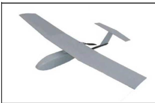
Рис. № 6 – БПЛА самолетного типа.

Существуют БПЛА, предназначенные для выполнения задач РЭР, РЭБ и связи. Скоростной диапазон работы - от 15 до 30 м/с. Рабочие высоты - в зависимости от оборудования и размеров аппарата, но всегда превышают 300 м. Обычно это диапазон высот 300 - 2000 м. Существует несколько аэродинамических схем самолетных БПЛА. Основные аэродинамические схемы – классическая (рис. № 6) и «летающее крыло» (рис. № 7).