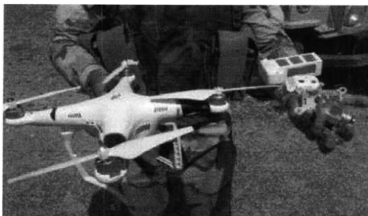
Рис. № 1 - БВС вертолетного типа.

Для совершения диверсионных актов могут использоваться БВС самолетного и вертолетного типа (рис. № 1) кустарного производства, причем доля последних значительно превышает количество самолетных. Объясняется это в первую очередь их более низкой стоимостью.