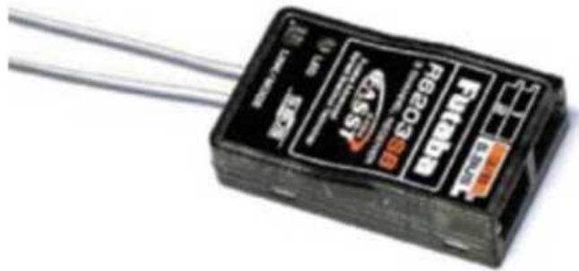
Рис. № 11 - Приемник аппаратуры управления.

Видеопередатчик (рис. № 10) - это устройство, передающее на наземную станцию изображение с камер БПЛА. Является самым заметным устройством на борту БПЛА, поэтому без необходимости включать его не стоит (это касается только тех БПЛА, которые хранят фотографии на борту), соблюдая режим радиомолчания. Такой режим уменьшает возможность применения противником средств РЭБ.