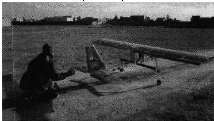
Рис. № 4 - малогабаритный летательный аппарат.

БВС-камикадзе является весьма специфичным классом беспилотной техники, информация о котором чаще всего носит секретный характер. Такой дрон представляет собой малогабаритный летательный аппарат (рис. № 4), способный нести несколько килограмм взрывчатки.