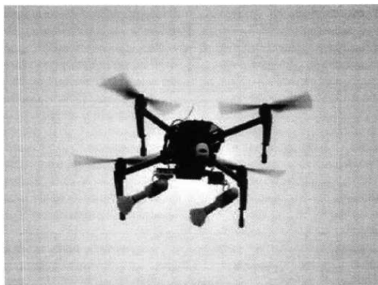
Рис. № 3 – квадрокоптер.

На квадрокоптерах также изменяется система управления камерой таким образом, чтобы над целью вытягивать леску и высвободить гранату. Корпус может быть пластмассовый и снабжен небольшим количеством поражающих элементов. Основу для самодельных бомб могут составить переделанные фабричные боеприпасы. Например, выстрелы ВОГ-17А и ВОГ-17М. Также используются безгильзовые гранаты ВОГ-25. Взрыв ВОГ сравним со взрывом ручной гранаты РГД-5. При взрыве ВОГ-25 образуется большая масса мелких осколков, которые обеспечивают сплошное покрытие осколками в радиусе 10 метров. При таком взрыве все не защищенные участки тела поражаются осколками.