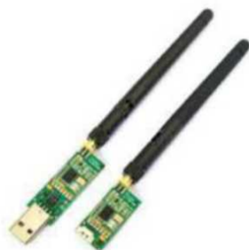
Рис. № 9 - Модем телеметрии.

Модем телеметрии (рис. № 9) - приемное устройство, предназначенное для обмена информацией между наземной станцией и БПЛА. От наземной станции он посылает команды к выполнению, от БПЛА - принимает на наземную станцию информацию, получаемую с датчиков (например, скорость, потребление тока, напряжение, положение в пространстве). Обычно является основным каналом управления БПЛА.