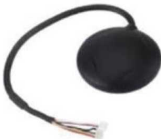
Рис. № 8 - Модуль GPS-навигации.

Рассмотрим радиопередающие системы, установленные на БПЛА.